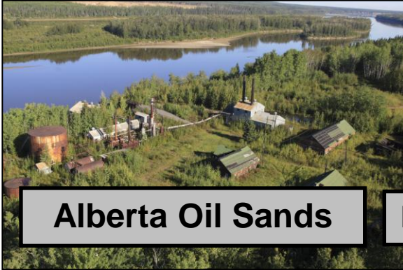
Alberta Oil Sands