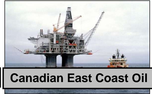
Canadian East Coast Oil

Arbetar målmedvetet för att bygga upp en stark marknadsprofil som ett integrerat olje- och gasbolag