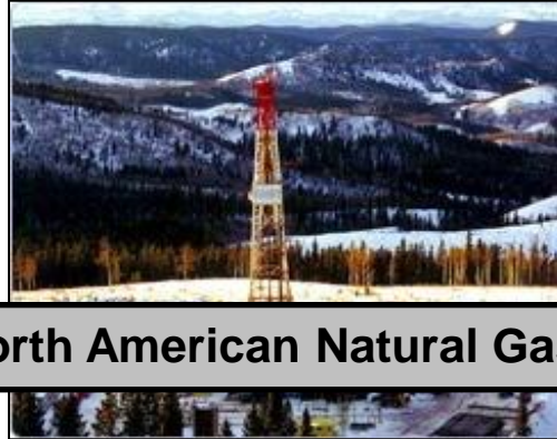
North American Natural Gas